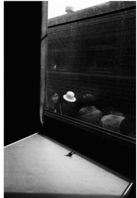
TRANSIBÉRIEN, MONGOLIE, 2005